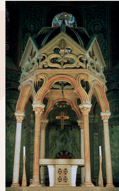
Maria Laach: Die vorderen Säulen des Baldachins über dem Hochaltar sind aus Kalksinter des Römerkanals gefertigt.

In Ermangelung anderer Schmucksteine hat man diesen „Aquäduktmarmor“ genutzt, um die Bauten der Romanik auszuschnücken. Gehandelt wurde dieser Baustoff in halb Europa: Alle Dome entlang des Hellweges, die Kathedralen von Roskilde in Dänemark und in Canterbury sowie viele Kirchen in den Niederlanden sind mit Säulen, Altar- oder Grabplatten aus Aquäduktmarmor ausgeschmückt.