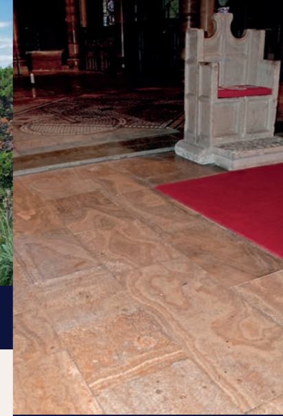
Ein Exportschlager des Mittelalters: Kalksinter aus der Eifelwasserleitung als Aquäduktmarmor verlegt unter dem Bischofssitz der Kathedrale von Canterbury (England)

Da die Transportwege zu den Marmorbrüchen in Norditalien im hohen Mittelalter für Schwertransporte nicht mehr nutzbar waren und somit nördlich der Alpen kein Schmuckstein bei den Bauten der Romanik zur Verfügung stand, mussten die Baumeister eine Ersatzlösung finden. Für die in der romanischen Zeit gebauten Kirchen, Klöster und Burgen des Rheinlandes hat man deshalb nicht nur die Steine der Wasserleitung wieder ausgebrochen, um Baumaterial zu gewinnen – ein besonderes Ziel dieses mittelalterlichen „Steinraubes“ war die Kalksinterablagerung, aus der unter der Hand geschickter Steinmetzen ein ganz besonderer Marmor entstand.