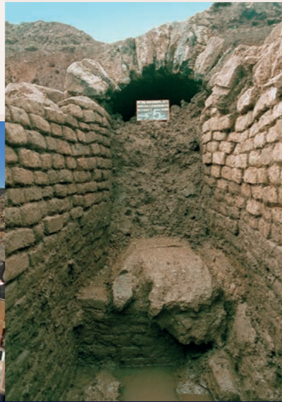
Erstmals archäologisch nachgewiesen: Eine Baugrenze im Verlauf einer römischen Wasserleitung (Mechernich-Lessenich)

Keine Wasserleitung im Imperium Romanum ist so gut erforscht wie die römische Eifelwasserleitung nach Köln, und in kaum einer anderen Wasserleitung wurden technische Elemente des antiken Wasserleitungsbaus in einer Vielfalt vorgefunden, wie hier am Rhein.