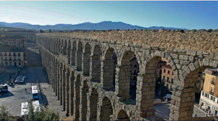
Aquäduktbrücke in Segovia (Spanien) – nur Teil einer römischen Wasserversorgung oder auch eine Demonstration römischen Machtanspruchs?

Es scheint, als hätten die römischen Ingenieure den Wasserleitungsbau genutzt, um das ganze Spektrum ihres Könnens aufzuzeigen. So werden im Bau der Aquäduktbrücken Dimensionen sichtbar, als habe man die Grenzen der Schwerkraft überschreiten wollen. In der Gefälleabstreckung wurden Werte erreicht, die an den in unseren Tagen ermittelten Messergebnissen regelrecht zweifeln lassen. In Allem wird eine gründliche Planungs- und Vermessungsarbeit erkennbar.