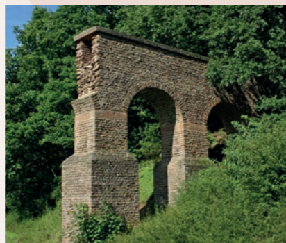
Mechernich-Vusse: Über Originalbefunden rekonstruierte Aquäduktbrücke

Hier gelang es erstmals, die Einteilung einer antiken Baustelle in Baulose archäologisch nachzuweisen: Ein massives Tosbecken bildete die Nahtstelle zwischen zwei Trassenabschnitten. Quellfassungen, Brücken, Sammelbecken und Absetzbecken sind nicht nur archäologisch untersucht worden, sie wurden danach restauriert, wo nötig mit Schutzbauten überdacht und im Verlauf des Römerkanal-Wanderweges – einem der ersten archäologischen Themenwanderwege in Deutschland – für die Öffentlichkeit zugänglich gemacht. Die Ausstellung gibt mit Fotos, Grabungsdokumentationen und Modellen einen tiefen Einblick in die Vielfalt dieses grandiosen Technikbaus.