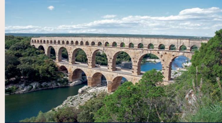
Nîmes (Südfrankreich): Pont du Gard

Hier gelang es erstmals, die Einteilung einer antiken Baustelle in Baulose archäologisch nachzuweisen: Ein massives Tosbecken bildete die Nahtstelle zwischen zwei Trassenabschnitten. Quellfassungen, Brücken, Sammelbecken und Absetzbecken sind nicht nur archäologisch untersucht worden, sie wurden danach restauriert, wo nötig mit Schutzbauten überdacht und im Verlauf des Römerkanal-Wanderweges – einem der ersten archäologischen Themenwanderwege in Deutschland – für die Öffentlichkeit zugänglich gemacht. Die Ausstellung gibt mit Fotos, Grabungsdokumentationen und Modellen einen tiefen Einblick in die Vielfalt dieses grandiosen Technikbaus.